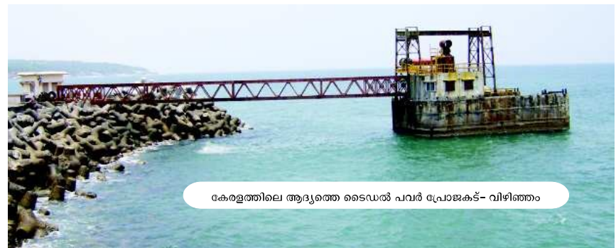
കേരളത്തിലെ ആദ്യത്തെ ടൈഡൽ പവർ പ്രോജക്ട്- വിഴിഞ്ഞം

ഏറ്റവും വലിയ തടാകം- കാസ്പിയൻ കടൽ ഏറ്റവും വലിയ കടൽ- കേഴിണ മെനാക്കടൽ ഏറ്റവും വലിയ സമുദ്രം- പസഫിക് ഏറ്റവും വലിയ സാർക്ക് രാജ്യം- ഇന്ത്യ ഏറ്റവും വടക്കായി സ്ഥിതി ചെയ്യുന്ന രാജ്യ തലസ്ഥാനം- ഓയ്ക്ടാവാക് ഏറ്റവും കനത്ത ബോംബിങ്ങിന് വിശേഷമായിട്ടുള്ള രാജ്യം- ലാവോസ് ഏറ്റവും കൂടുതൽ നഗരവൽക്കരിക്കപ്പെട്ടിട്ടുള്ള, ഇന്ത്യയിലെ മതവിഭാഗം- പാഴ്സികൾ ഏറ്റവും കൂടുതൽ മനുഷ്യരിൽ കണ്ടുവരുന്ന രക്തഗ്രൂപ്പ്- ഒ ഗ്രൂപ്പ് ഏറ്റവും കൂടുതൽ അക്ഷരങ്ങളുള്ള ഭാഷ- കാബോഡിയൻ ഏറ്റവും കൂടുതൽ രാജ്യങ്ങളുമായി അതിർത്തി പങ്കിടുന്ന രാജ്യങ്ങൾ- റഷ്യയും ചൈനയും ഏറ്റവും കൂടുതൽ ഉപഗ്രഹങ്ങളുള്ള ഗ്രഹം- വ്യാഴം ഏറ്റവും കൂടുതൽ വനവൽക്കരണ നിരക്ക് ഉള്ള രാജ്യം- ചൈന ഏറ്റവും കൂടുതൽ കാർബൺ ഡയോക്സൈഡ് പുറന്തള്ളുന്ന രാജ്യം- യു.എസ്.എ.