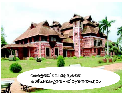
കേരളത്തിലെ ആദ്യത്തെ കാഴ്ചബഗ്ഗ്- തിരുവനന്തപുരം

ഏറ്റവും നിറങ്ങളെയും പ്രതിഫലിപ്പിക്കുന്ന പ്രതലം ഏതു നിറത്തിൽ കാണപ്പെടുന്നു- വെളുപ്പ് ഏറ്റവും നിറങ്ങളെയും ആഗിരണം ചെയ്യുന്ന പ്രതലം ഏതു നിറത്തിൽ കാണപ്പെടുന്നു- കറുപ്പ് എലിവിഷമായി ഉപയോഗിക്കുന്നത് രാസവസ്തു- സിങ്ക് പോസ്ഫേറ്റ് എവറസ്റ്റിന്റെ ഉയരം കണക്കാക്കിയത്- ജോർജ് എവറസ്റ്റ് എവറസ്റ്റ് കൊടുമുടി കണ്ടെത്തിയത്- രാധാനാഥ് സിക്തർ എവറസ്റ്റ് കൊടുമുടിക്ക് ആ പേരു നൽകിയത് - കേണൽ ആൻഡ്രൂവാൾ ഏറ്റവും നീളം കൂടിയ ഡക്കാൺ നദി- ഗോദാവരി ഏറ്റവും ഓരം കൂടിയ പ്രകൃതിദത്ത ആറ്റം- യുറോനിയം ഏറ്റവും ഓരം കൂടിയ വാതകമൂലകം- റാഡോൺ ഏറ്റവും ഓരം കൂടിയ ലോഹമൂലകം- ഓസ്മിയം ഏറ്റവും പ്രായം കൂടിയ അമേരിക്കൻ പ്രസിഡന്റ്- ഓബാമ ഏറ്റവും ഉയരത്തിൽ സ്ഥിതി ചെയ്യുന്ന തലസ്ഥാന നഗരം- ലാപാസ് ഏറ്റവും വലിയ പദസമ്പത്തുള്ള ഭാഷ- ഇംഗ്ലീഷ് ഏറ്റവും വലിയ ഭാഷാ ഗോത്രം- ഇന്തോ-യൂറോപ്യൻ ഏറ്റവും വലിയ ഉപനിഷത്ത്- ബൃഹദാരണ്യോപനിഷത്ത് ഏറ്റവും വലിയ ഉൾക്കടൽ- ഹാൾബർട്ട് ഉൾക്കടൽ ഏറ്റവും വലിയ ലാറ്റിനമേരിക്കൻ രാജ്യം- ബ്രസീൽ ഏറ്റവും വലിയ കുഞ്ഞിനെ പ്രസവിക്കുന്ന ജന്തു- നീലത്തിരിമീന