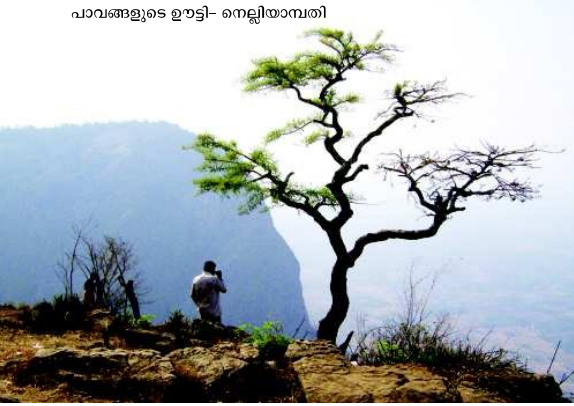
പാവങ്ങളുടെ ഉല്പാദനം- നെല്ലിയാമ്പതി