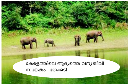
കേരളത്തിലെ ആദ്യത്തെ വന്യജീവി സങ്കേതം- തേക്കടി

മൽസരപ്പരീക്ഷകളിൽ ഏറ്റവും പ്രാധാന്യമുള്ള വിഷയമാണ് പൊതുവിജ്ഞാനം. വായനക്കാരുടെ അഭ്യർത്ഥനപ്രകാരം ഈ ലക്കം പൊതുവിജ്ഞാനം സ്പെഷ്യലായി പ്രസിദ്ധീകരിക്കുന്നു. സ്വാഗതം: ആർ.സി. സുരേഷ്കുമാർ